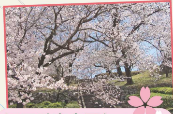
旧円融寺庭園 | 玖島2丁目