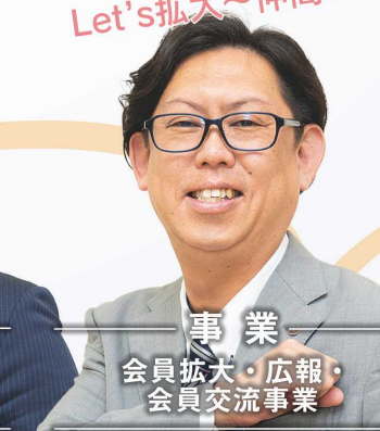
事業 会員拡大・広報・ 会員交流事業