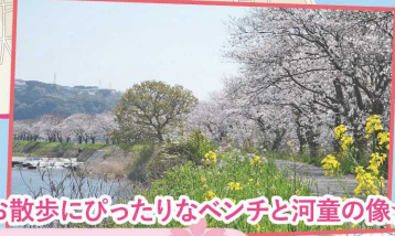
お散歩にぴったりなベンチと河童の像★