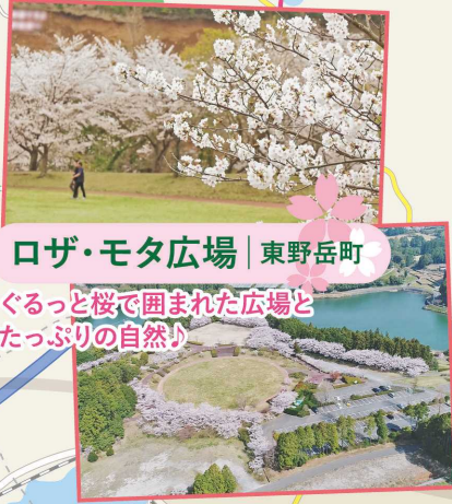
ロザ・モタ広場 | 東野岳町