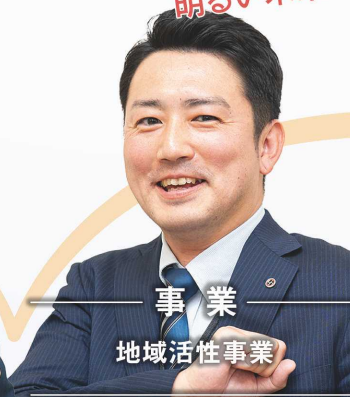
事業 地域活性化事業