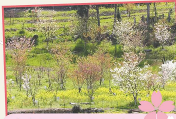
赤似田さくら園 | 野田町