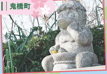
郡川 | 鬼橋町