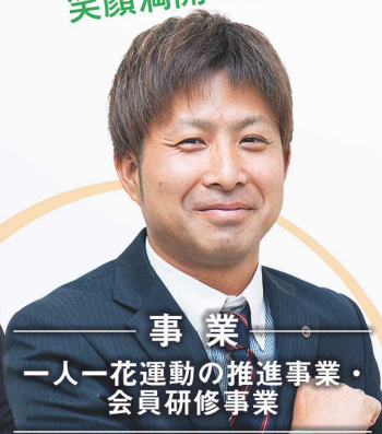
事業 一人一花運動の推進事業・ 会員研修事業