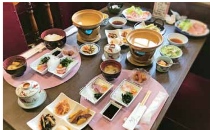
▲オーダーバイキング 昼 1,490円/夜 1,980円(税抜) 小学生以下 980円(税抜)