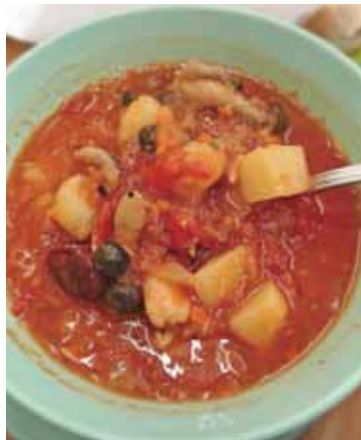
▲トマトとチキンの豆のスープ(420円)