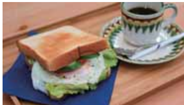
▲サンドイッチセット(500円)