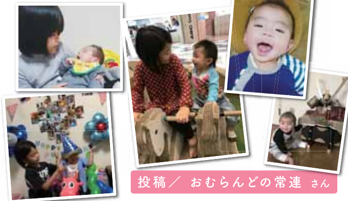
投稿 / おむらんど常連さん

3人とも同じお腹で育ったのに、性格バラバラの家族全員B型なスーパー自由な我が家ですが、時には厳しく、家族みんなで愛情伝え合ってそれぞれの長所を輝かせてあげたいと、周りに感謝しながら子育て奮闘します！