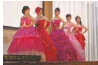
※写真は過去の様子

大村高校家政科では毎年3年生がドレス制作に取り組んでいます。デザインから生地を選んで型紙に起こし、そして縫いあげていく全てを生徒たち自身でやるのがすごいですよね。出来上がったドレスは秋の文化祭でファッションショーとして披露されます。そのドレス制作の現場におじゃましました。