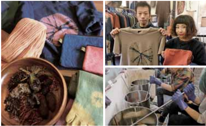
▲イストイストでは受注制作、リメイク染め、シルクスクリーンも行なっています。

店内には、「ピンク」「青」とかで表現できないような色のバッグや服、5本指ソックス、ストールなどが並んでいて、なんだか心が落ち着きます。年配の人が用いるイメージがある草木染めですが、カジュアルな製品も多く、移転してからはふらりと立ち寄る若いお客さんも増えたそうです。また「草木染め体験」ができるのも人気の秘密。1~2時間でできる藍染め体験や、煮出し染め体験があり、時間や染めたいものに合わせて、1人から体験できます。(前日までに要予約)気になる方、ホームページをチェックしてみてください。